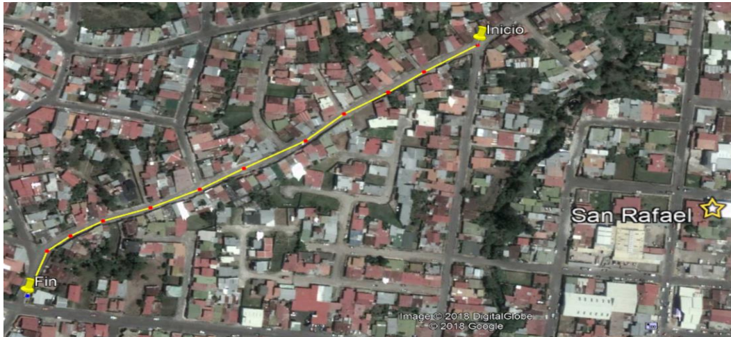
Ilustración No. 2 Interconexiones